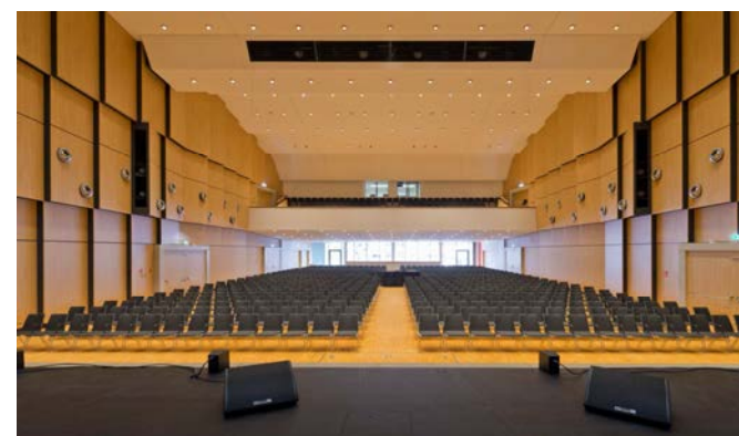
Stadthalle Bad Neustadt an der Saale