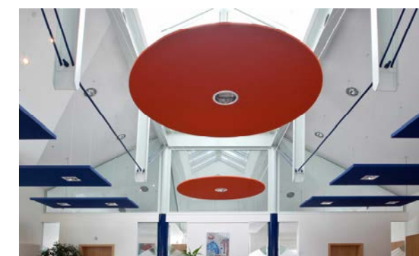
Volksbank Hellweg eG