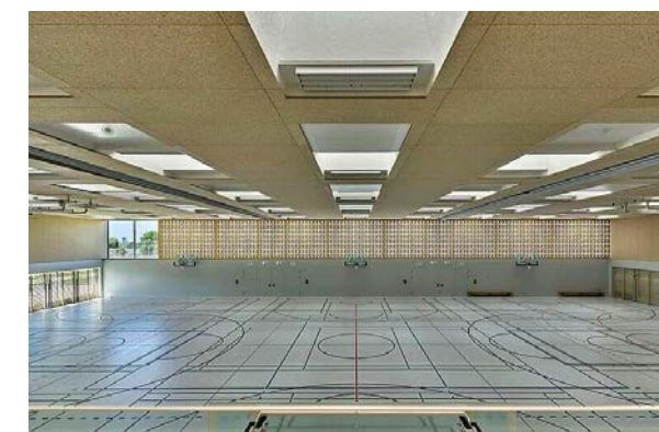
Sporthalle Frankfurt am Bogen