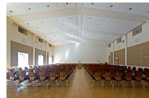
Henning-von-Treskow Kaserne, Schwielowsee